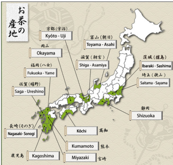
Abb. 1: Japanische Teeanbauggebiete. Ab Ende der Muromachi-Zeit galt der Pulverte Tee Toganoo (桐尾), gewachsen im Norden von Kyoto als Bester Honcha. (d. h. „wirklicher Tee,“ der bei den Probierversammlungen zu erkennen war; Gegenteil hicha) Diese Teeplantage führt sich auf die von Eisai an Myōe gegebenen Samen zurück. Später nahm dann der im Süden von Kyoto, in Uji, gewachsene diese Stellung ein, wofür auch heute noch die meisten Tee Meister eintreten. Andere Quelle führen den Tee in Japan auf Saichō zurück, es gibt auch Quellen die belegen, daß bereits der Shōmu-tennō mit besuchenden chinesischen Mönchen Tee trank (ohne daß ein Anbau im Lande stattfand). Erntezeit ist

Hütet euch vor den Einsiedlern der neuen Zeit! Zwar tragen sie Mönchsgewand, aber innen sind sie (reißende) Füchse. 1