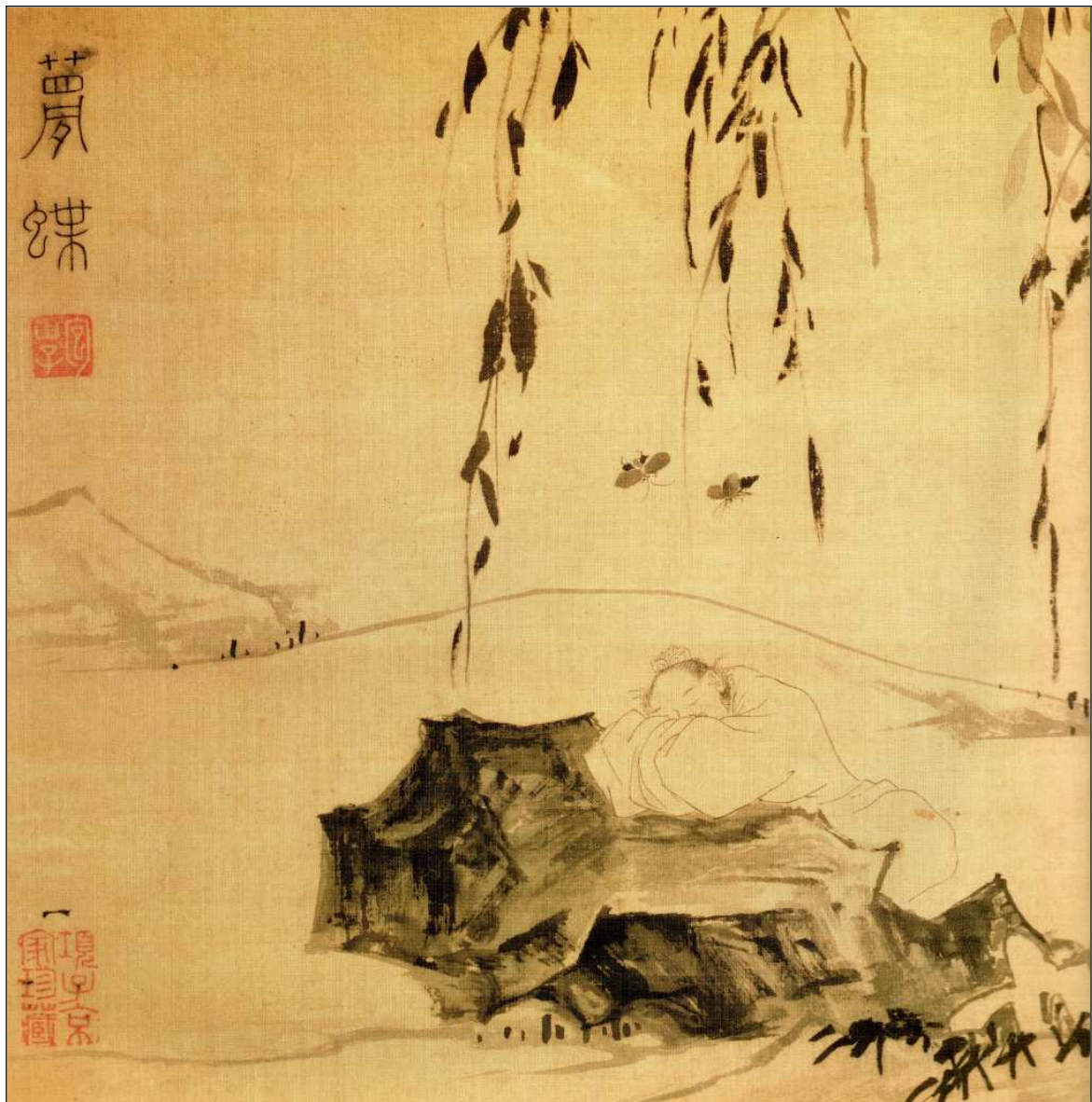
Abb. 3: Von Lù Zhì (陸治; ca. 1496-1576) gefertigtes Gemälde des „Schmetterligstraums“ des Zhuāng Zǐ (Tusche auf Seide, 29,4 × 51,4 cm).

e Dschuang Dsi „Das wahre Buch vom südlichen Blütenland;“ Buch II (übersetzt von Richard Wilhelm): Einst träumte Dschuang Dschou, daß er ein Schmetterling sei, ein flatternder Schmetterling, der sich wohl und glücklich fühlte und nichts wußte von Dschuang Dschou. Plötzlich wachte er auf: da war er wieder wirklich und wahrhaftig Dschuang Dschou. Nun weiß ich nicht, ob Dschuang Dschou geträumt hat, daß er ein Schmetterling sei, oder ob der Schmetterling geträumt hat, daß er Dschuang Dschou sei, obwohl doch zwischen Dschuang Dschou und dem Schmetterling sicher ein Unterschied ist. So ist es mit der Wandlung der Dinge. Derselbe Text bei Gundert: Dschuang Dschou, erzählt er von sich selbst, träumte einmal, er sei ein Schmetterling und flattere umher. Er fühlte sich beglückt und wußte nichts von Dschou. Plötzlich erwachte er und war nun richtig wieder Dschou. Hat es nun Dschuang Dschou geträumt, er sei ein Schmetterling, oder träumt es jetzt dem Schmetterling, er sei Dschuang Dschou? Und doch ist zwischen Dschou und einem Schmetterling gewiß ein Unterschied. Das heißt Verwandlung der Dinge.