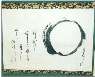
Abb. 2: „Enso“-Kalligraphie.

Was soll dieser runde Kreis? Ein Kreis 6 ist gezeichnet und mitten darin der Name des Edeln, (居士, Kōji ) Sōeki oder eines anderen Wegbeflissenen (道人, Dōjin ) geschrieben, und außerdem außen seitwärts berühmte Worte (desselben). Dabei stellt man gewöhnlich im Teegemache den Butsujigama (Kessel für buddhistisches Ritual) zu diesem Bilde auf. Was gesagt werden will, ist: All das Unzählige, was lebt und webt, lebt und west darinnen; das Groß-Rund-Spiegel-Wissen (die all-vollkommene alles spiegelnde Weisheit II 大圓鏡智) ist dies, der Wahre Leib ( hontai , 本体) des Wahrhaftigen Leeren Erscheinungsform-losen (真空無相, Shinkū-musō ).